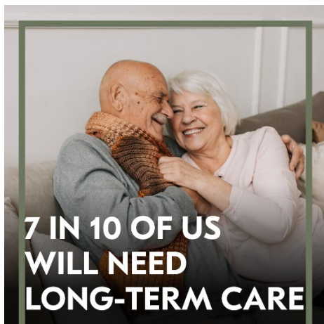
IMAGEN PARA PUBLICACIÓN:

Descargue una versión de alta calidad de esta imagen.