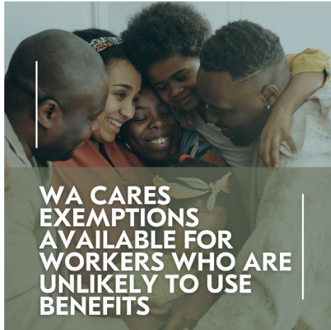
IMAGEN PARA PUBLICACIÓN:

Descargue una versión de alta calidad de esta imagen.