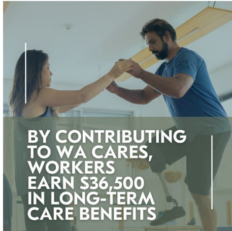
IMAGEN PARA PUBLICACIÓN:

Descargue una versión de alta calidad de esta imagen.