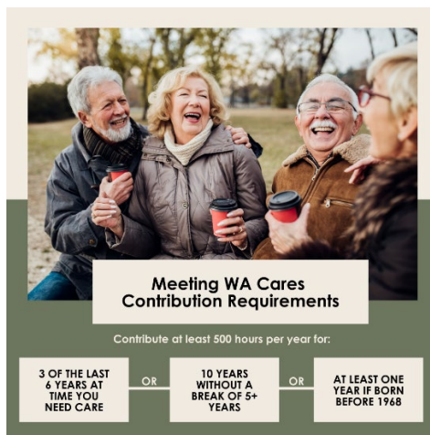
IMAGEN PARA PUBLICACIÓN:

Descargue una versión de alta calidad de esta imagen.