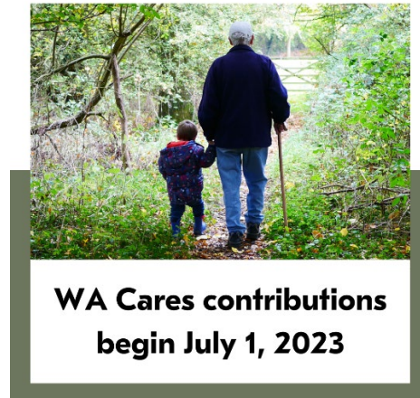
IMAGEN PARA PUBLICACIÓN:

Descargue una versión de alta calidad de esta imagen.