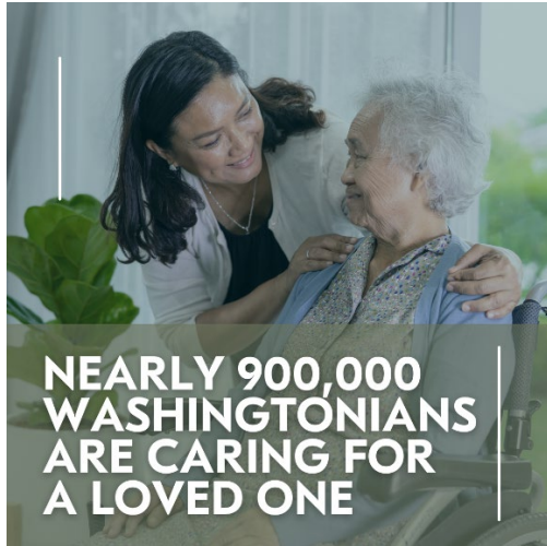
IMAGEN PARA PUBLICACIÓN:

Descargue una versión de alta calidad de esta imagen.