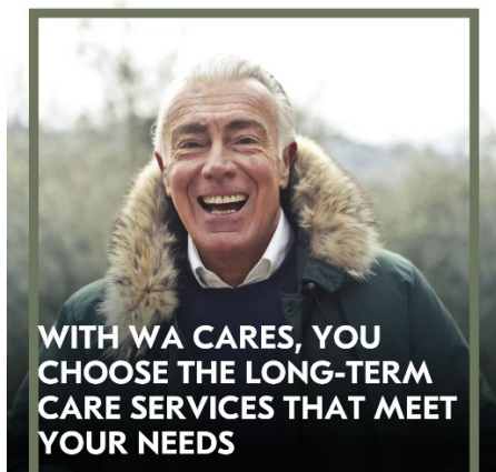
IMAGEN PARA PUBLICACIÓN:

Descargue una versión de alta calidad de esta imagen.